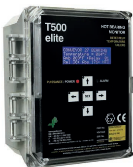
T500 Hotbus Elite

Los sensores de temperatura pueden utilizarse con los siguientes monitores de control: