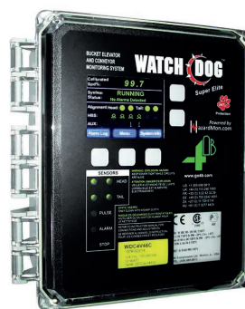
Watchdog Super Elite WDC4