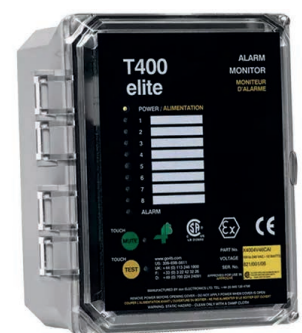
T400 NTC Elite